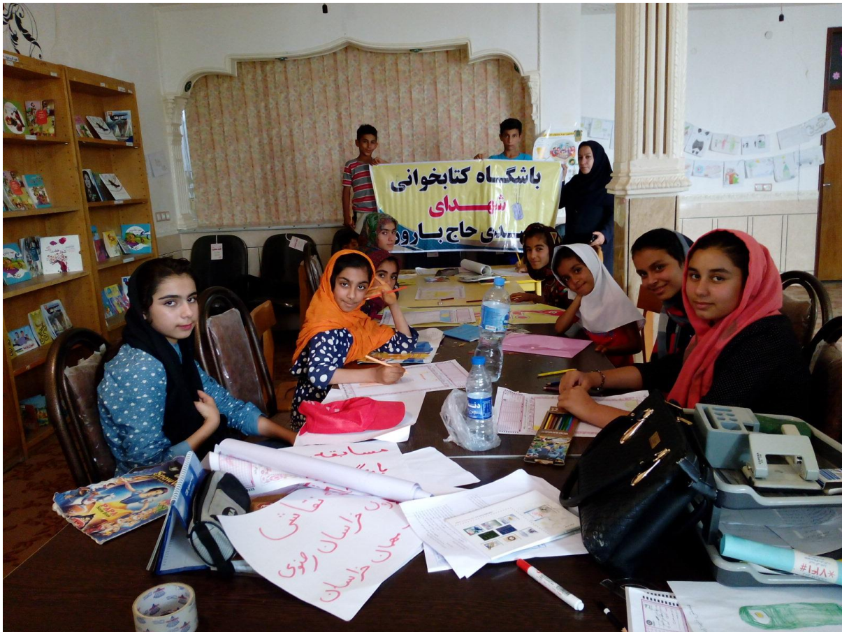
۶- دوره‌می خانوادگی برای خواندن کتاب : بچه‌های عضو باشگاه کتاب خوانی شهیدای باصدی هرکدام به عنوان سفیران کتاب خوانی در خانواده‌های خود دوره‌می کتابخوانی برگزار می‌کند.