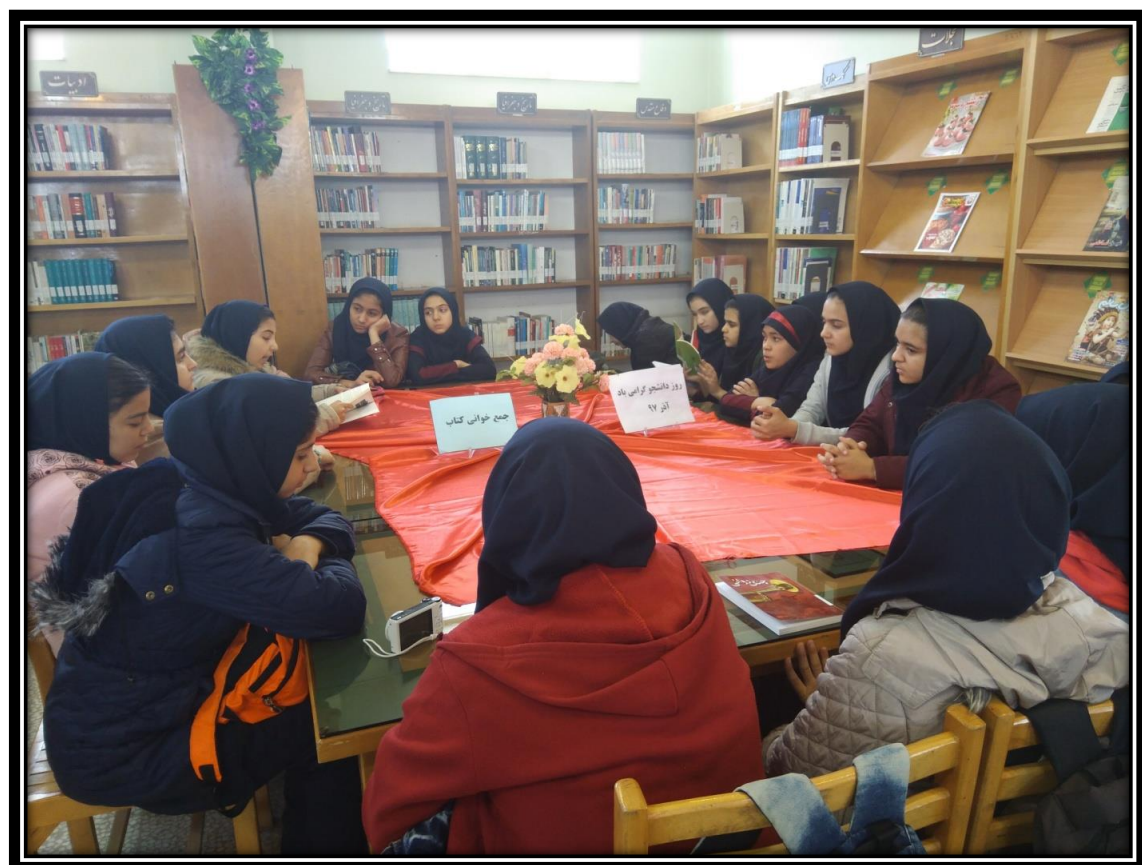
جمع خوانی کتاب به مناسبت نه دی ۹۷