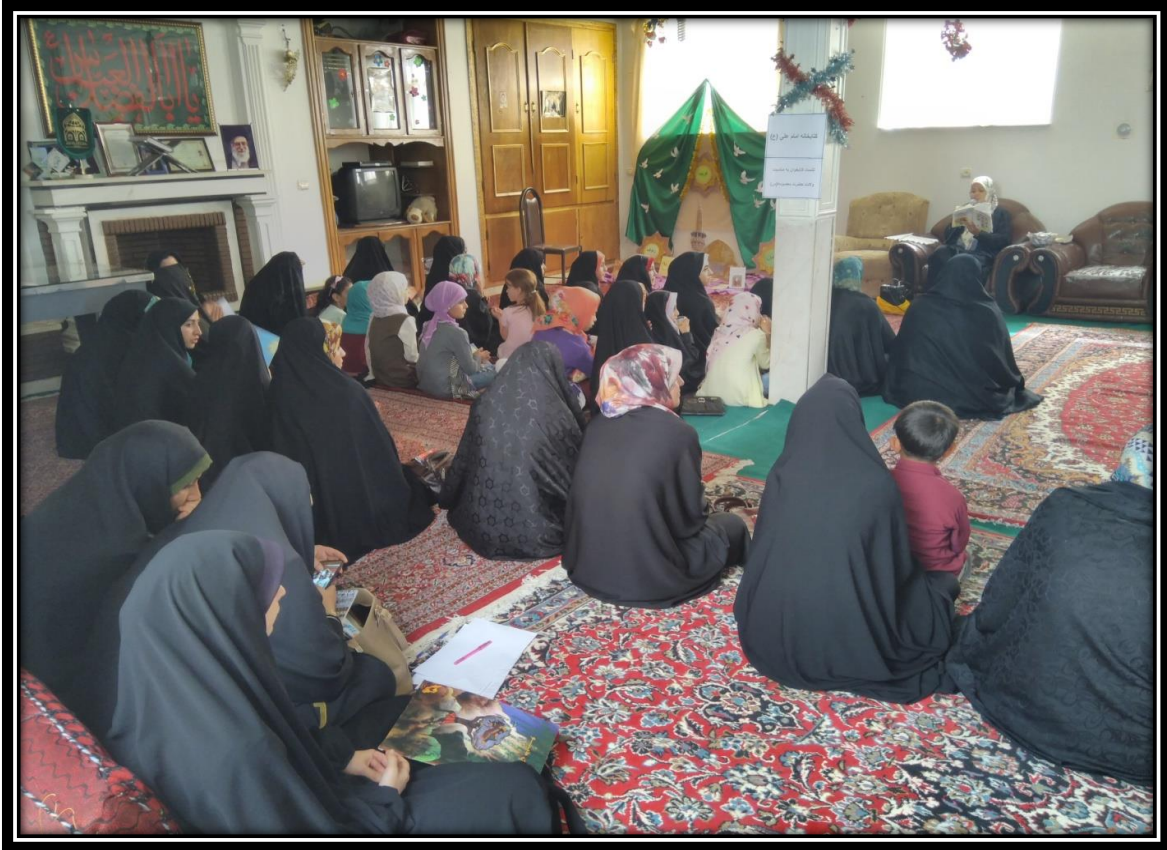
معرفی کتاب توسط بانوان