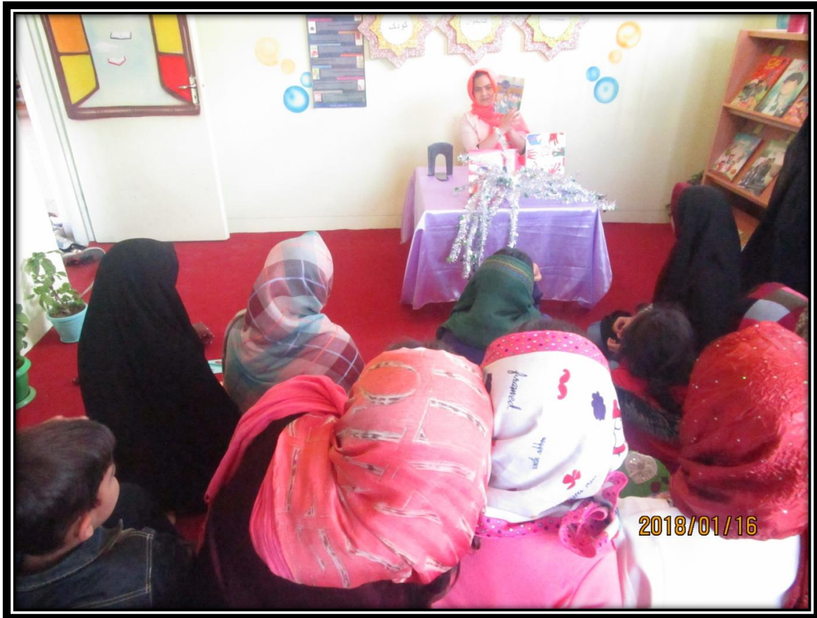
نشست کتابخوان به مناسبت دهه فجر