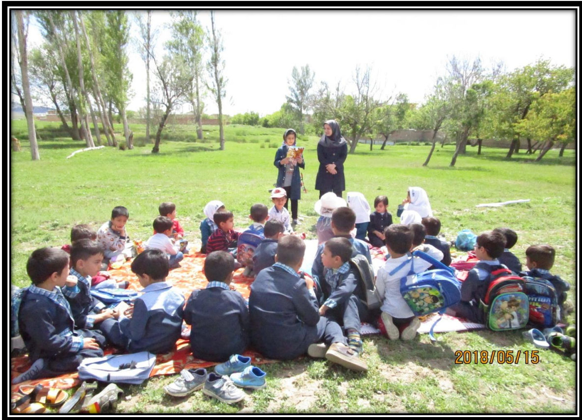
قصه گویی در طبیعت