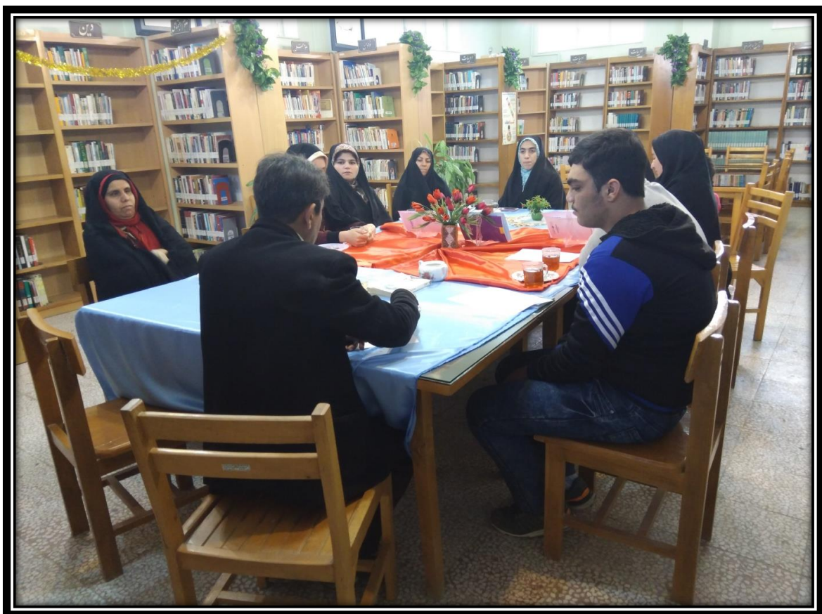
قصه گویی در هفته کتاب