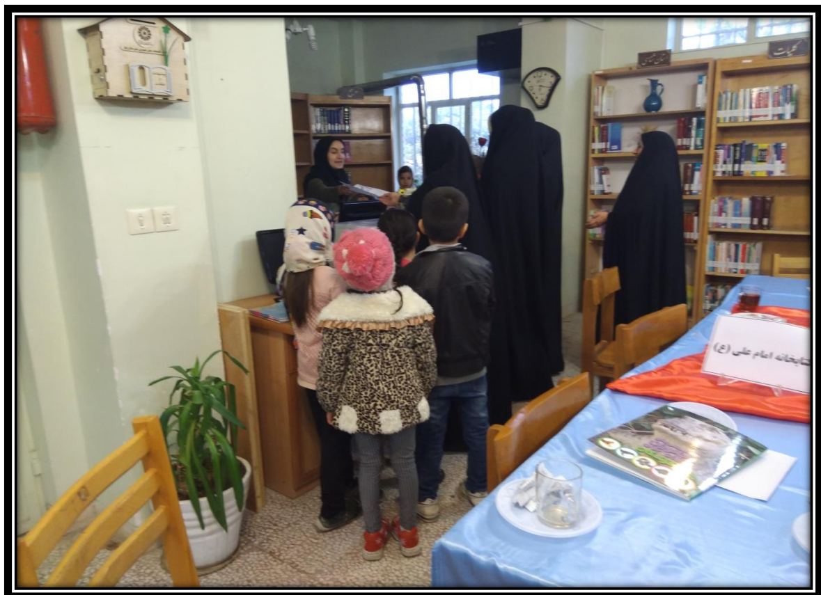
جشن هفته کتاب