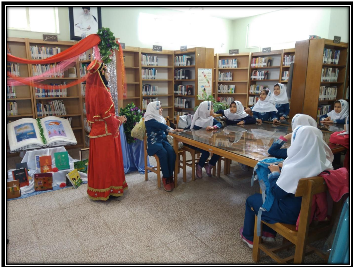
بازدید از نمایشگاه