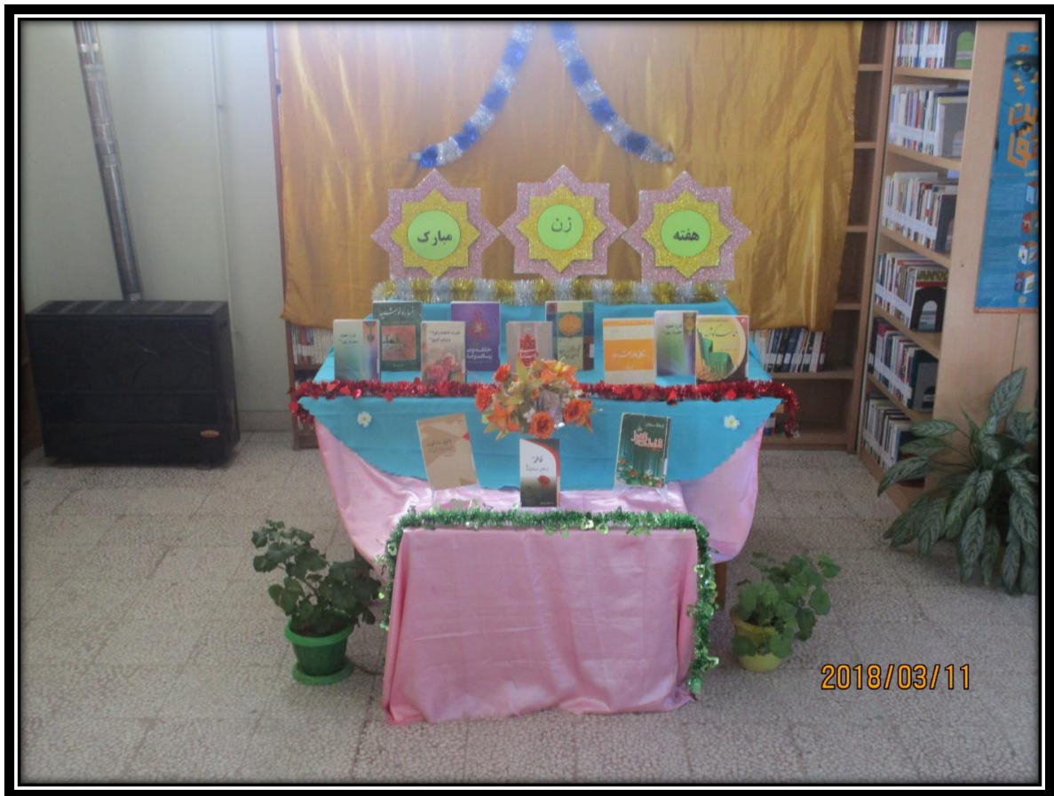
نمایشگاه کتاب به مناسبت جشنواره رضوی