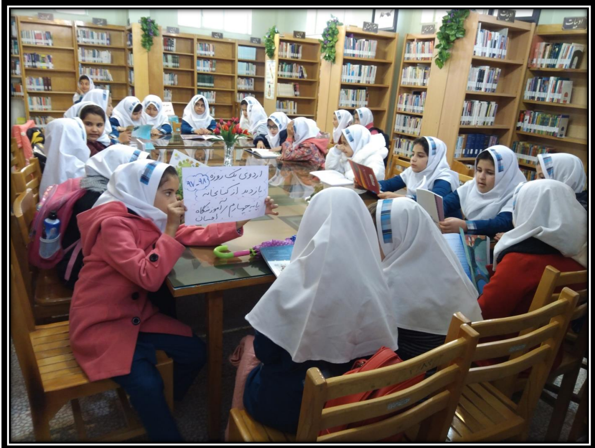
بلند خوانی کتاب