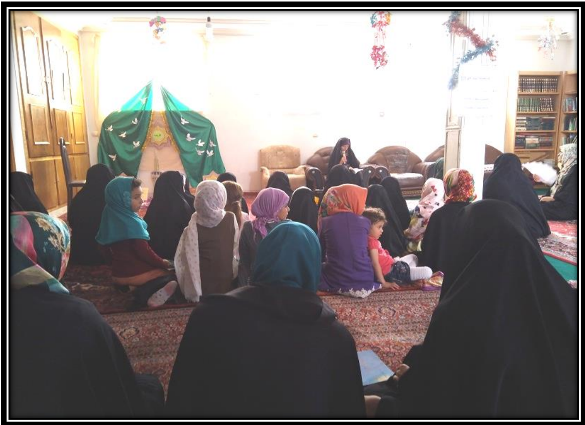
اهدای جوایز به معرفی کنندگان کتاب