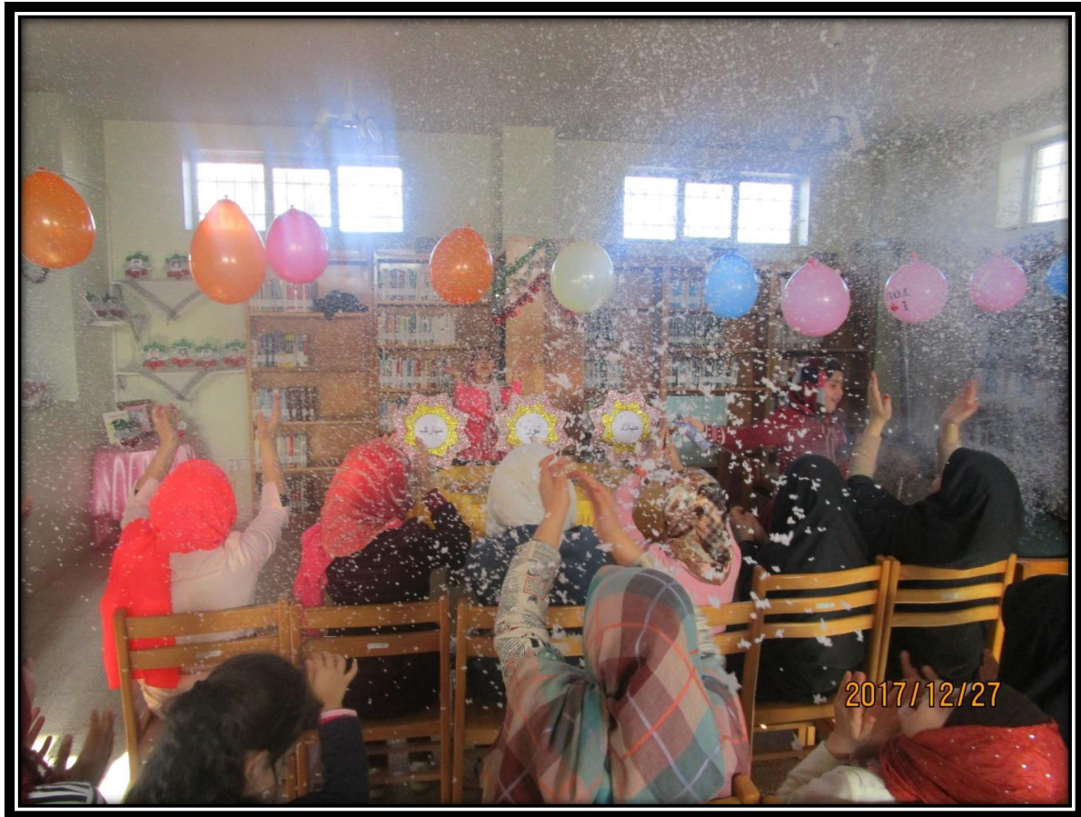
خواندن سرود گروهی