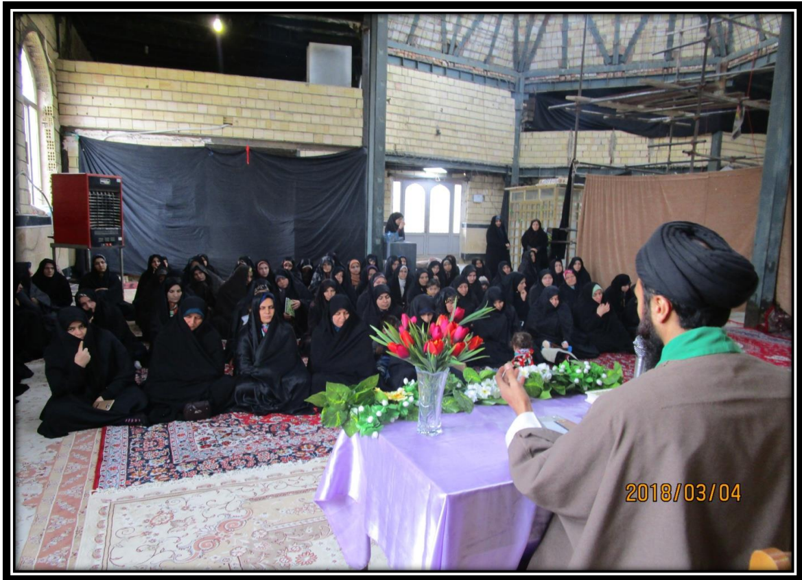
معرفی خدمات کتابخانه و معرفی کتاب توسط کتابدار روستا