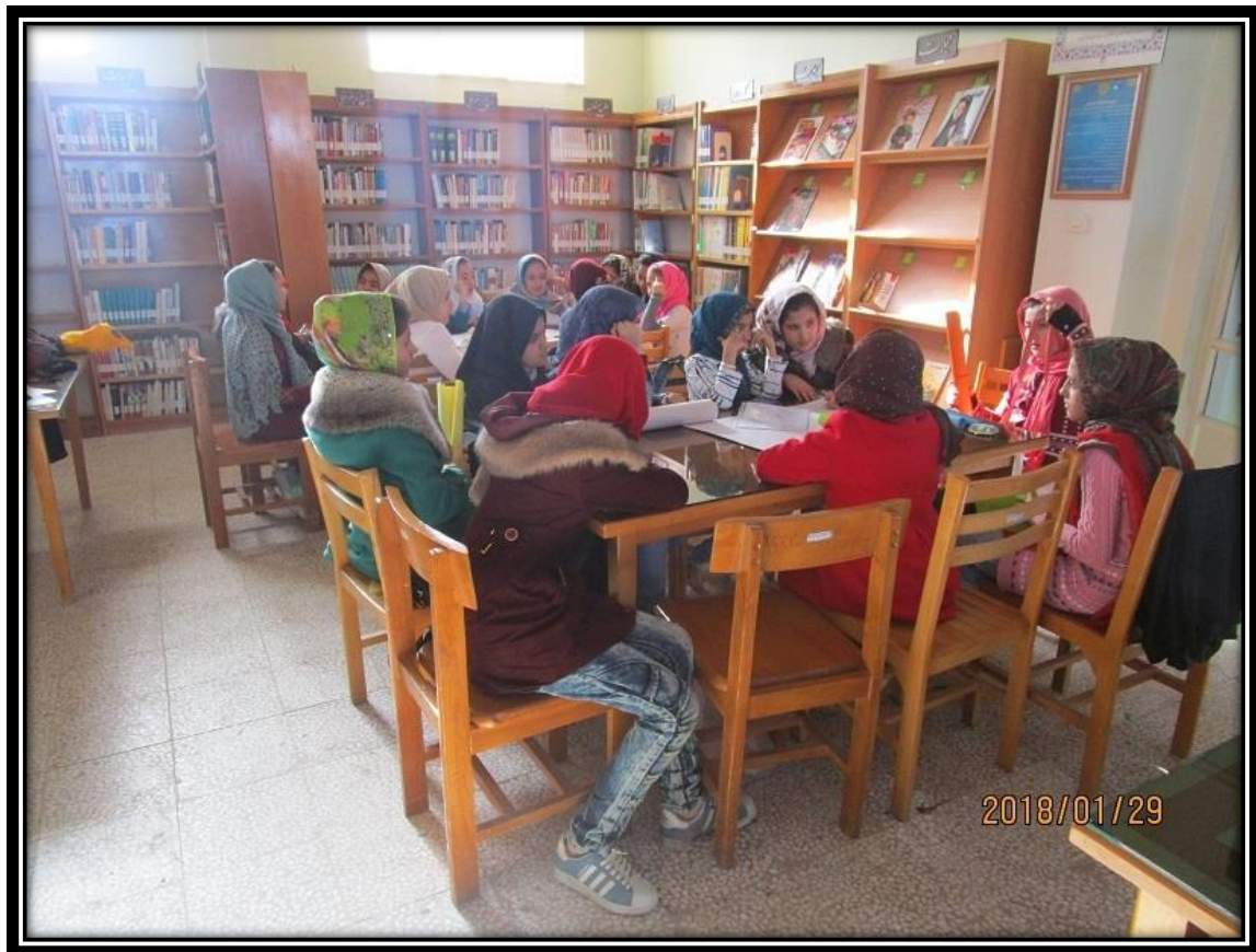
ساخت روزنامه دیواری به مناسبت هفته کتاب