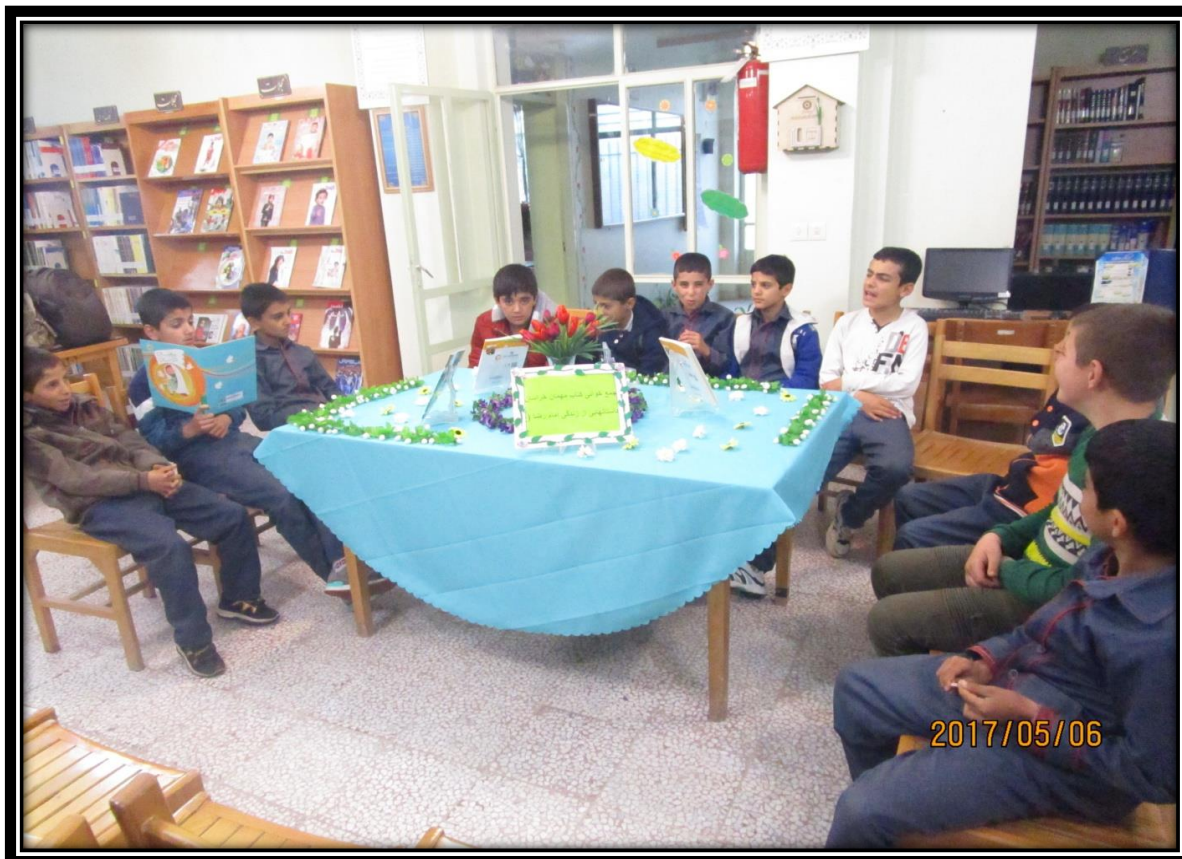
جمع خوانی کتاب به مناسبت محرم