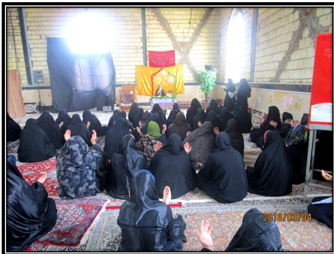
فرم شماره ۲- فعالیت‌های انجام شده*