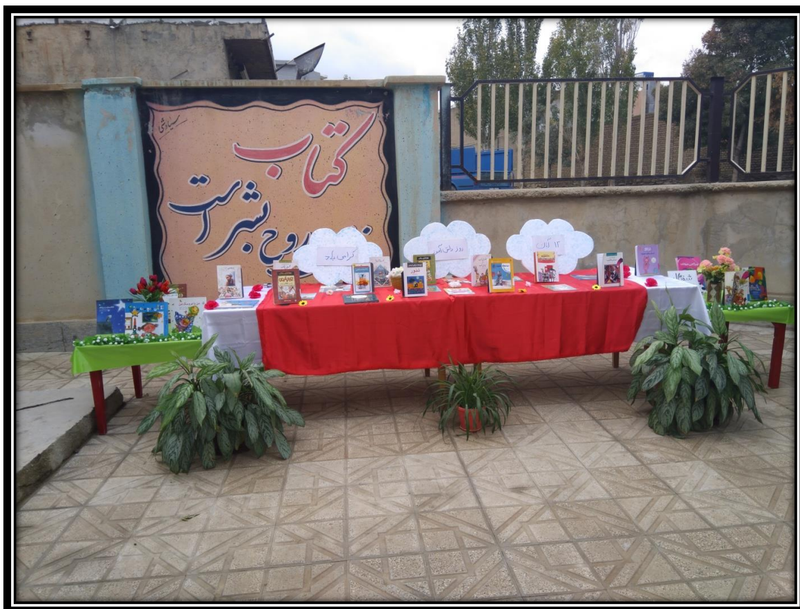
نمایشگاه کتاب به مناسبت هفته کتاب