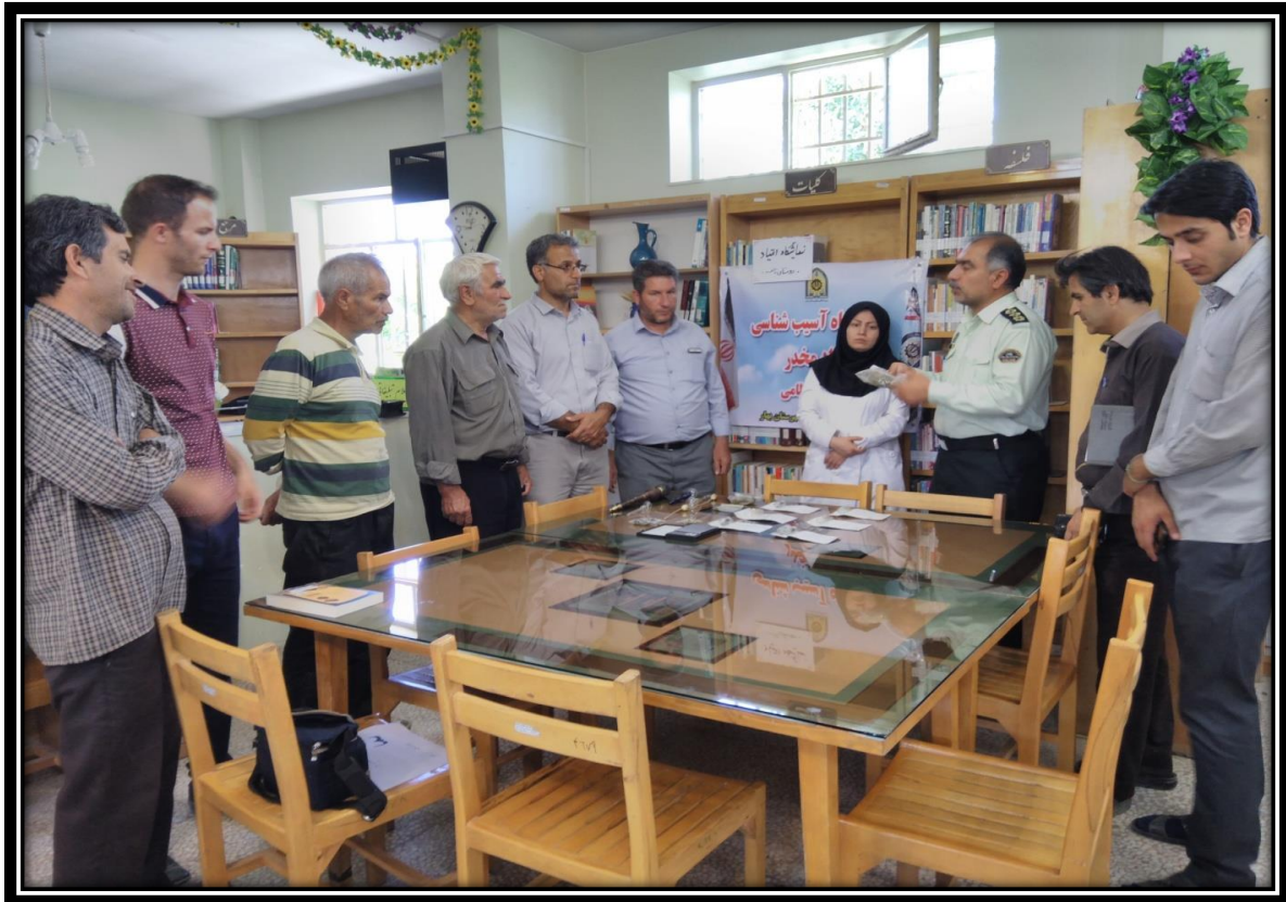
برگزاری کلاس آموزشی با موضوع مواد مخدر