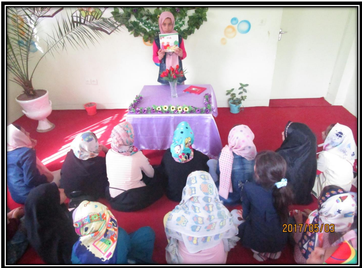
نشست کتابخوان عید غدیر