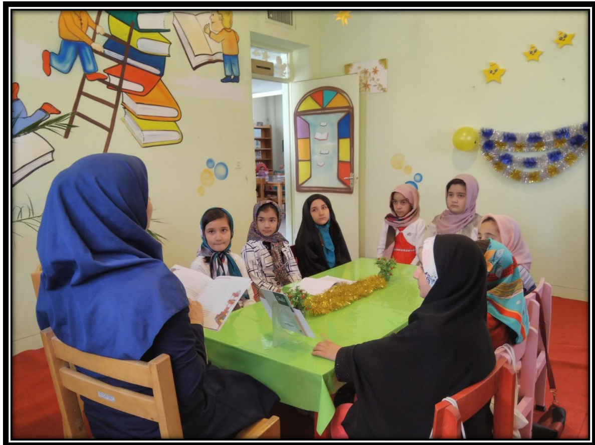
قصه گوئی به مناسبت هفته دفاع مقدس