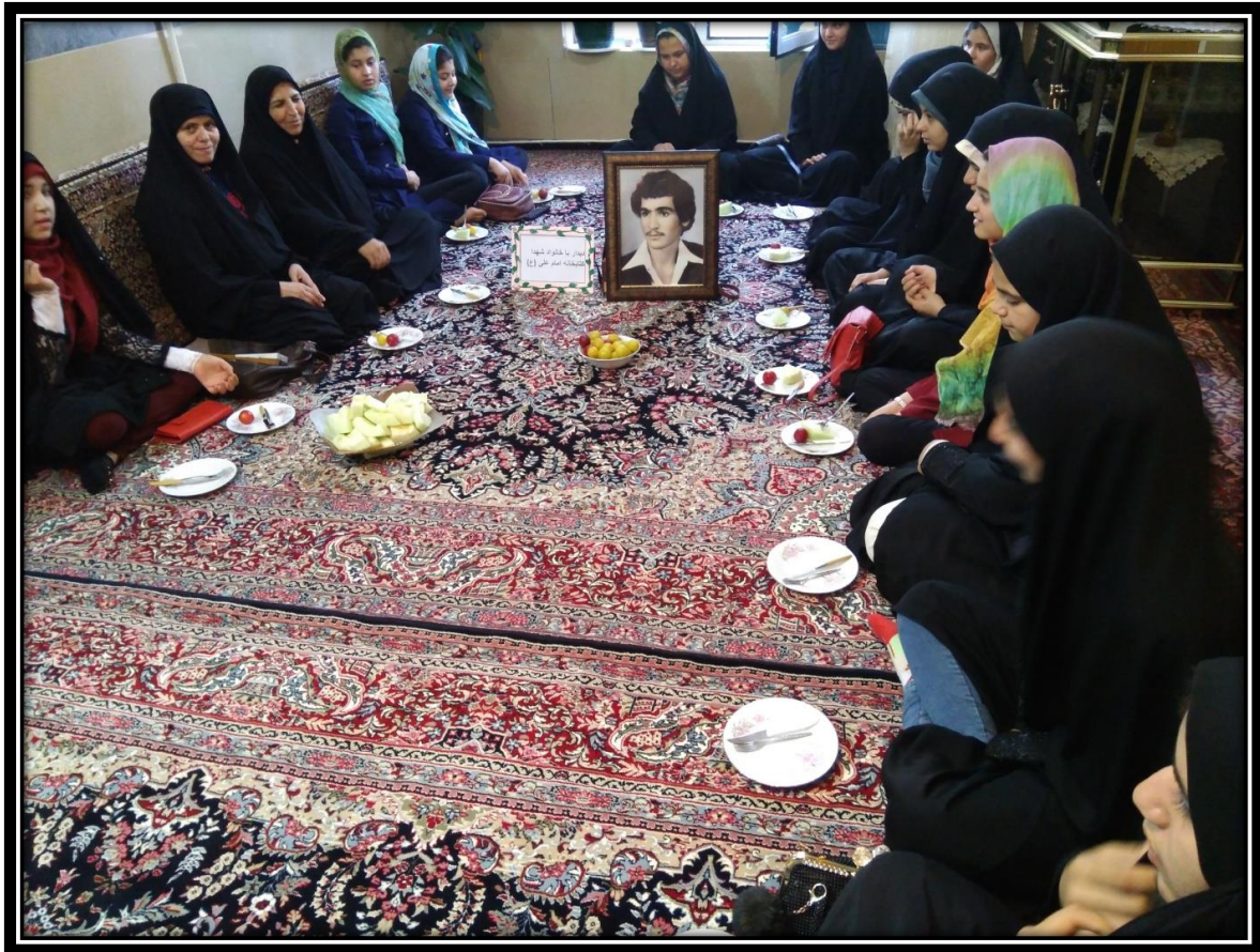
دیدار با خانواده شهید باقری