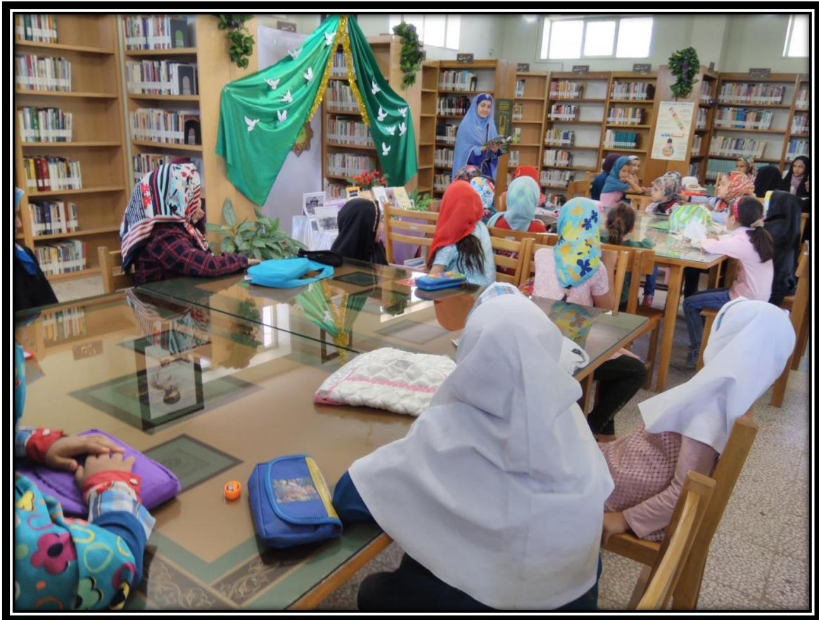
قصه گویی به مناسبت عید فطر