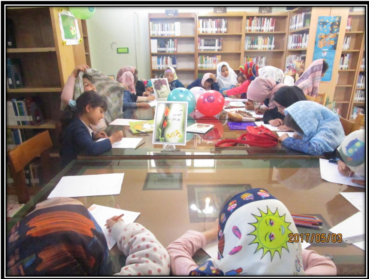
جمله نویسی در کتابخانه به مناسبت نه دی