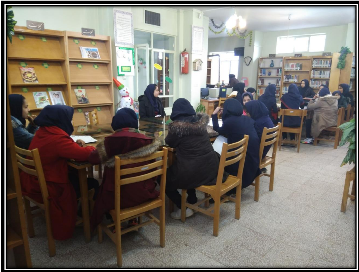
بازدید از کتابخانه به مناسبت ولادت حضرت زهرا (س)