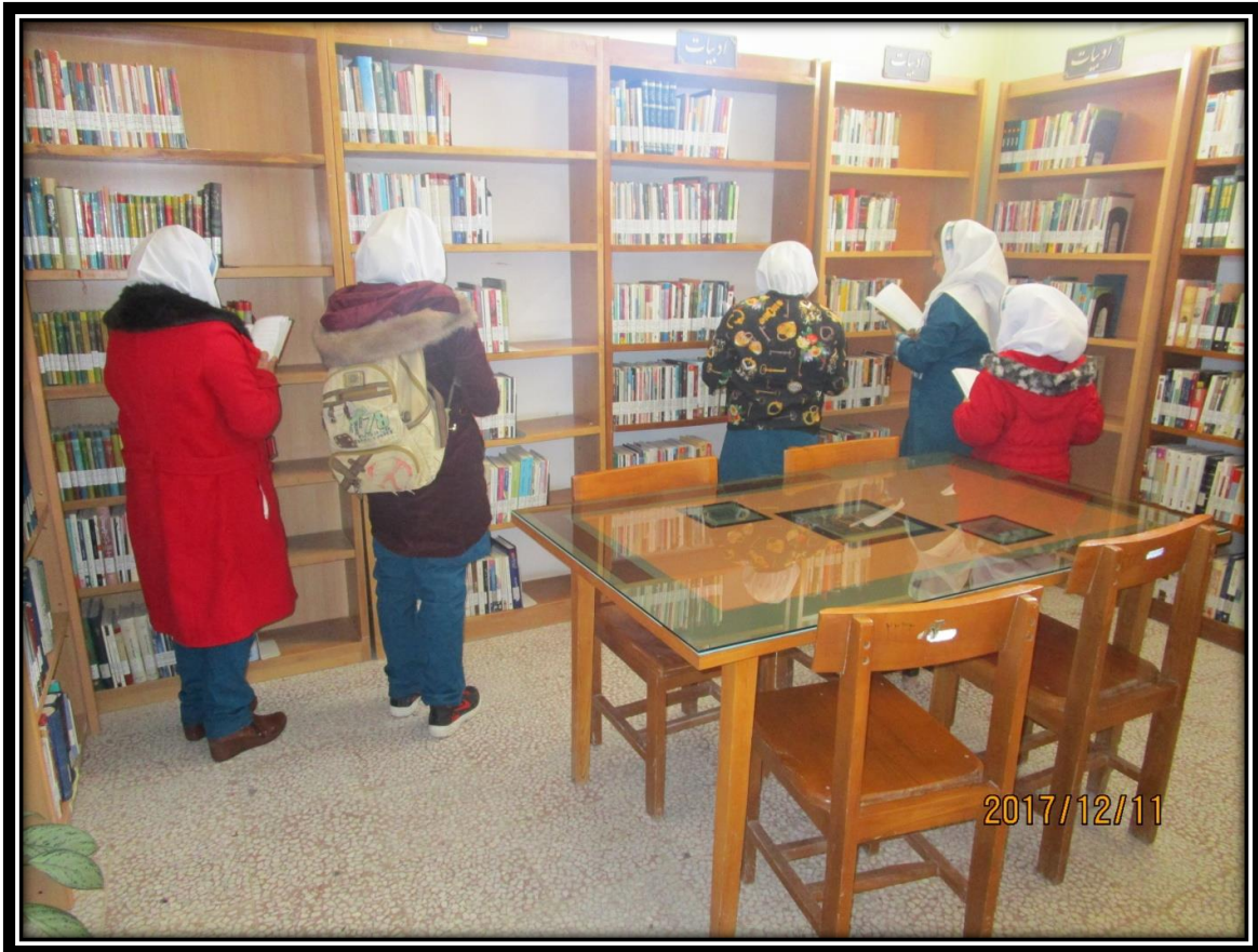
بازدید از کتابخانه به مناسبت هفته کتاب ۹۷