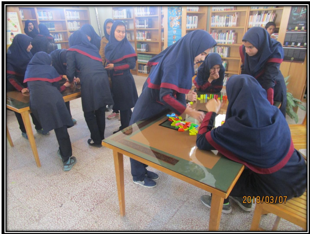
مسابقه دومینو به مناسبت ولادت حضرت علی (ع)