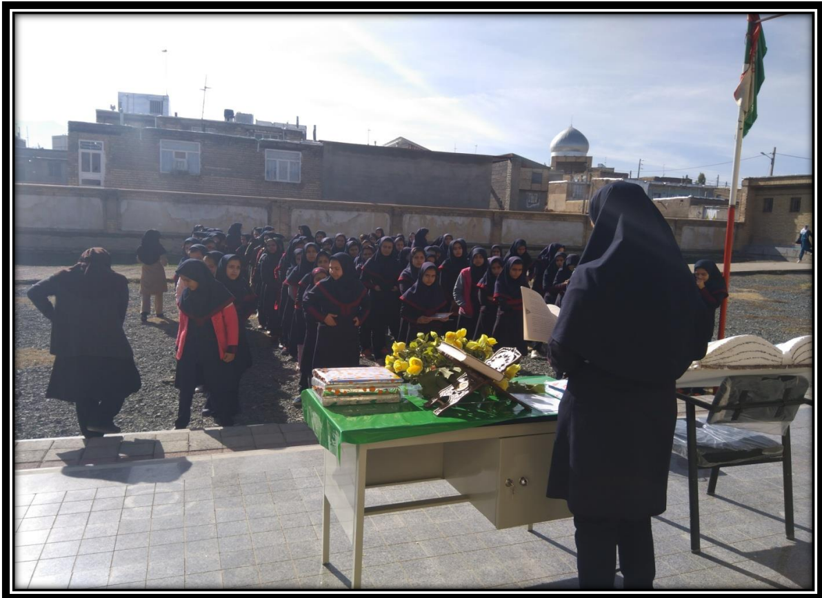
نشست کتابخوان به مناسبت نه دی