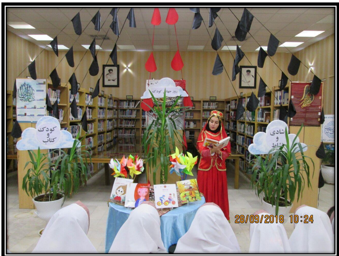
قصه گویی در کتابخانه با هنر به مناسبت یلدا ۹۷