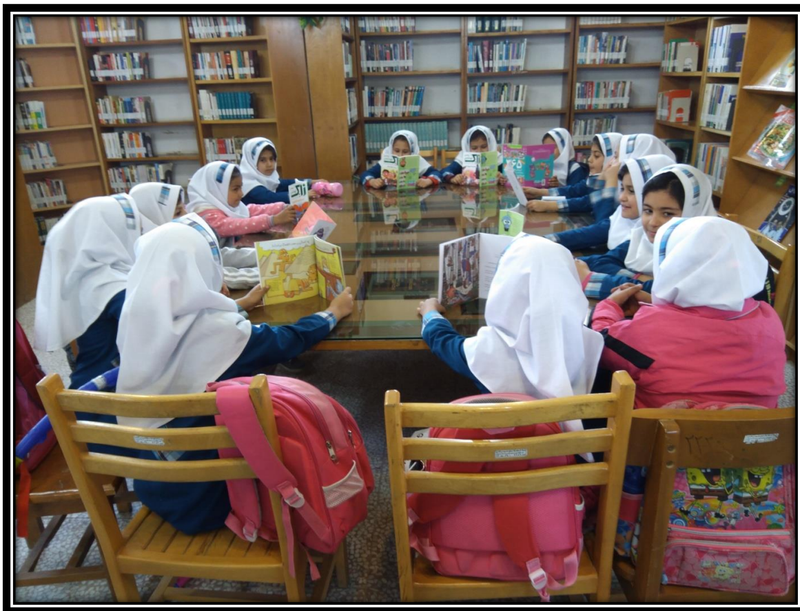
بازدید از کتابخانه به مناسبت روز دانش آموز