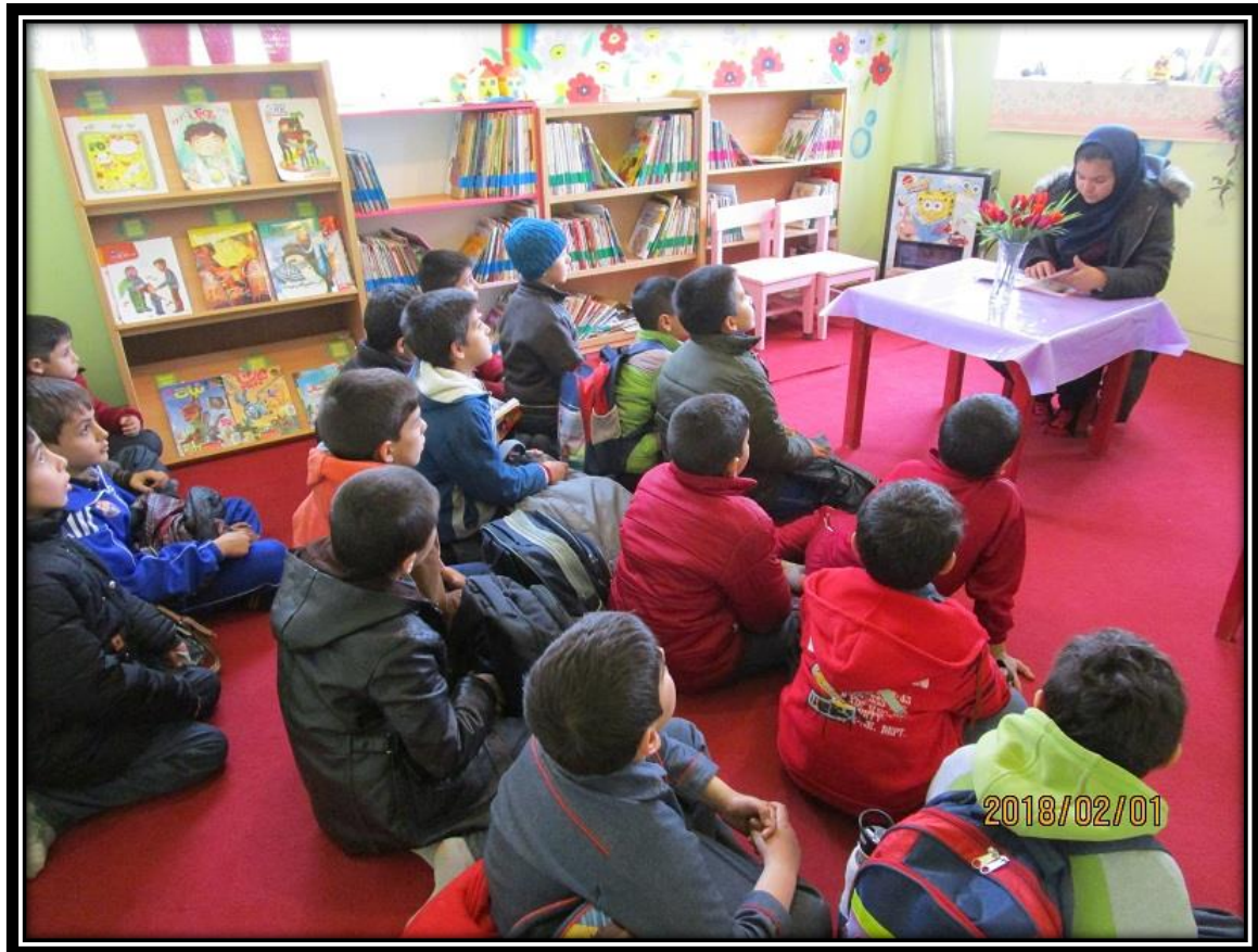
قصه گویی به مناسبت جشنواره رضوی