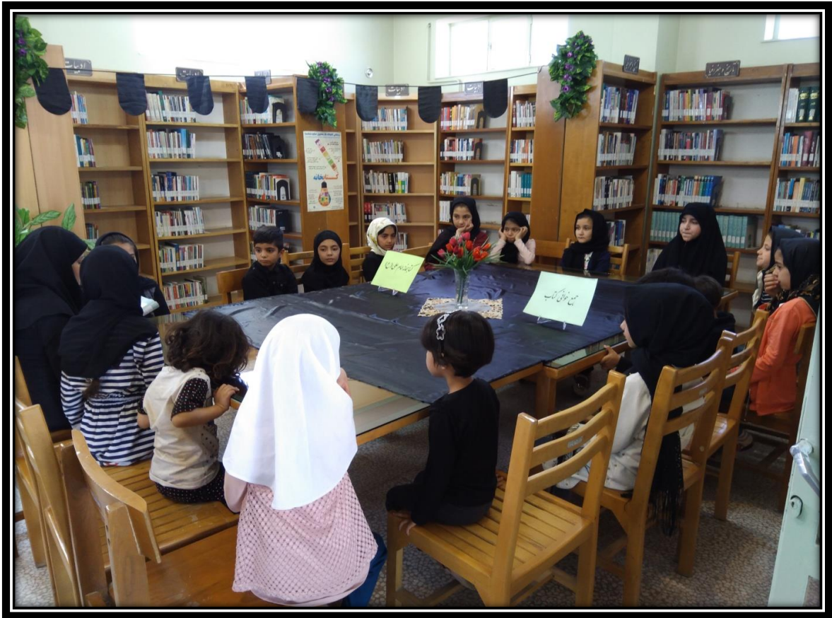
جمع خوانی به مناسبت جشنواره رضوی