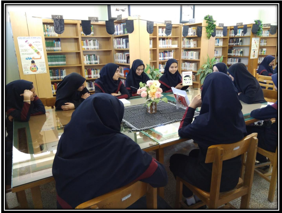
نشست کتابخوان هفته کودک