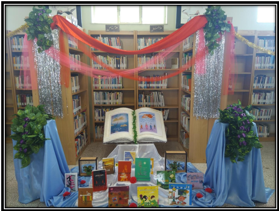
نمایشگاه کتاب به مناسبت رحلت امام خمینی (ره)