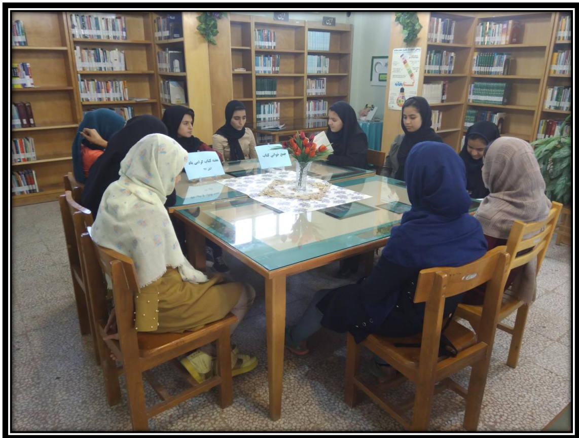
جمع خوانی کتاب به مناسبت نه دی