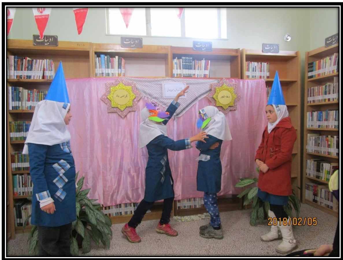
فرم شماره ۲- فعالیت‌های انجام شده*