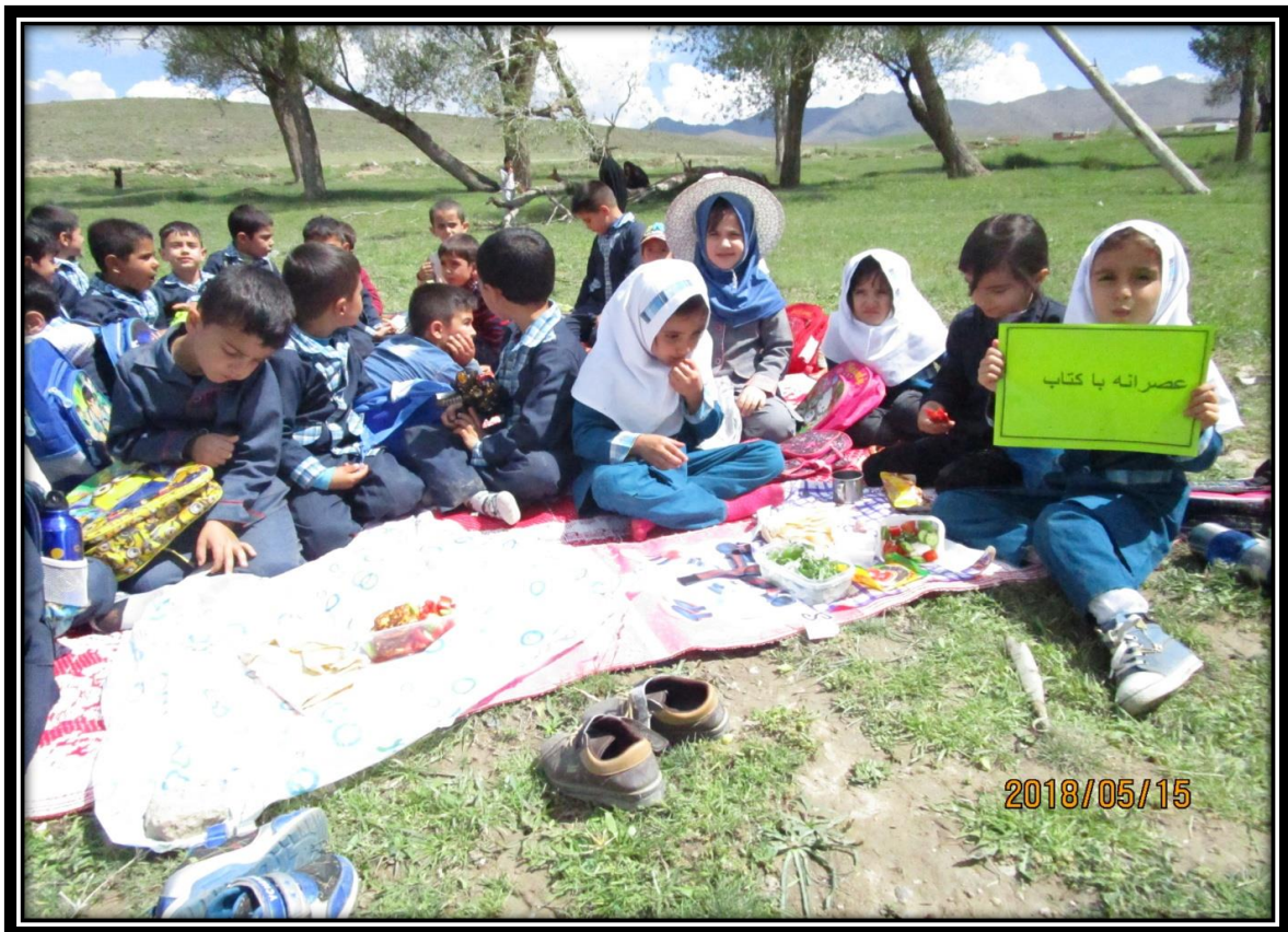
شعر خوانی در طبیعت