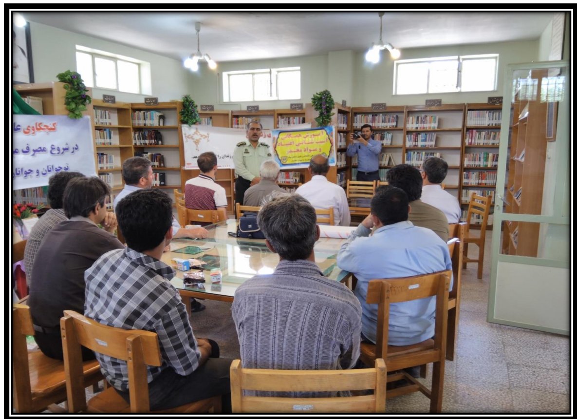
نمایش انواع مواد مخدر