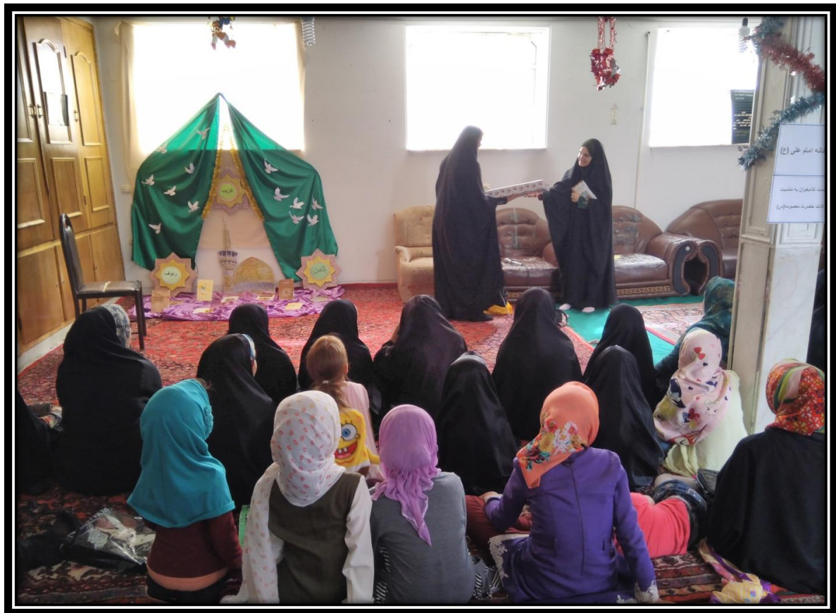
معرفی خدمات کتابخانه توسط مسئول کتابخانه