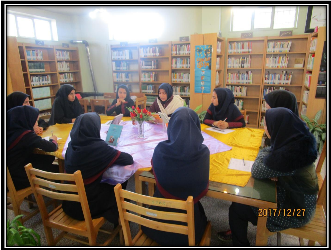
جمع خوانی کتاب به مناسبت عید نوروز