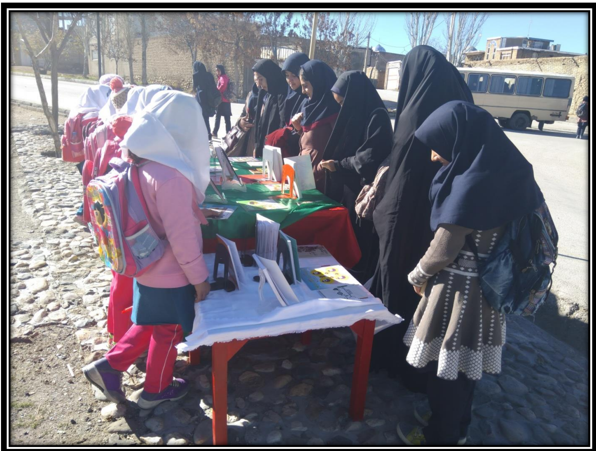
برگزاری نمایشگاه کتاب در خانه بهداشت روستا