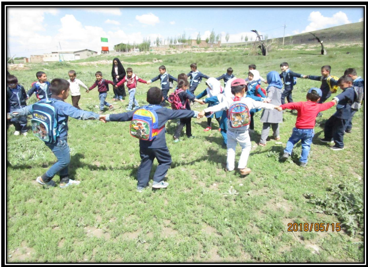
صرف عصرانه در طبیعت