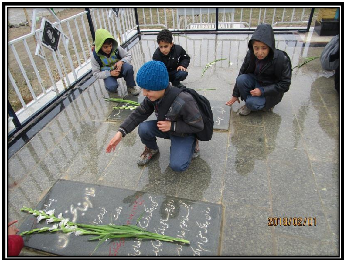
عطر افشانی گلزار شهدا به مناسبت سوم خرداد ۹۷