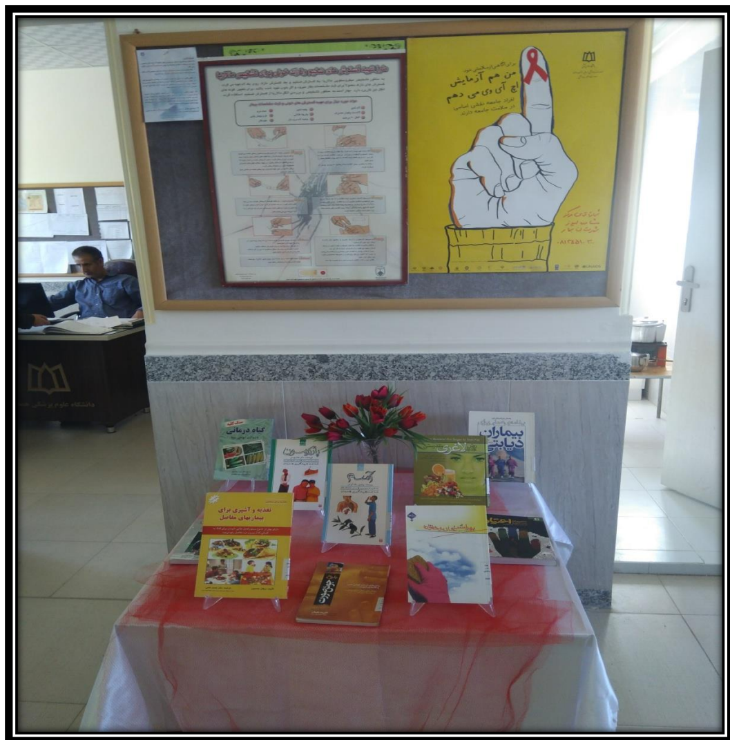
برگزاری نمایشگاه کتاب در محل جامعه القرآن