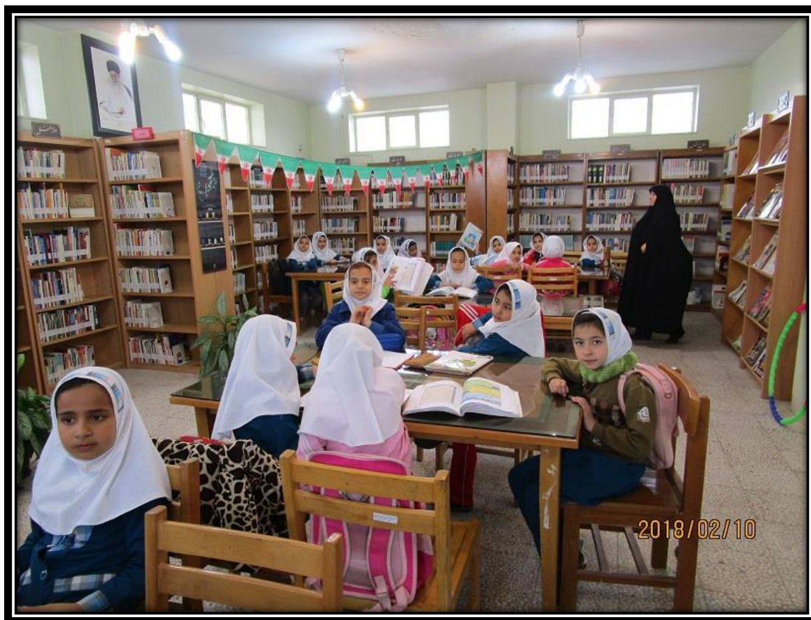
بازدید از کتابخانه به مناسبت جشنواره رضوی