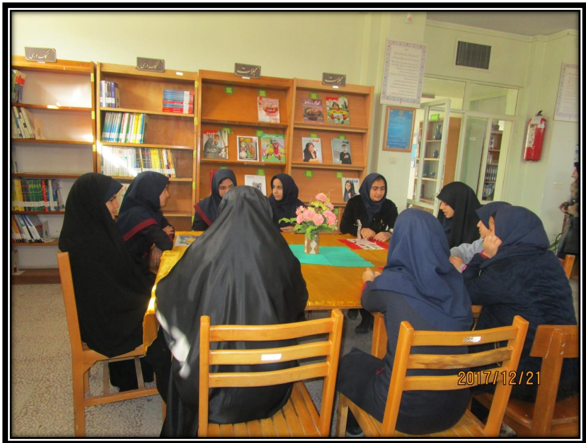
شاهنامه خوانی یلدا ۹۷