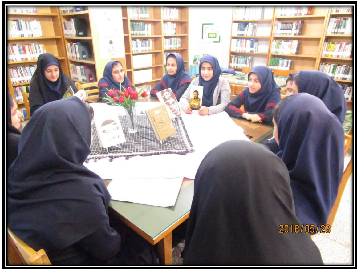
نشست کتابخوان جشنواره رضوی