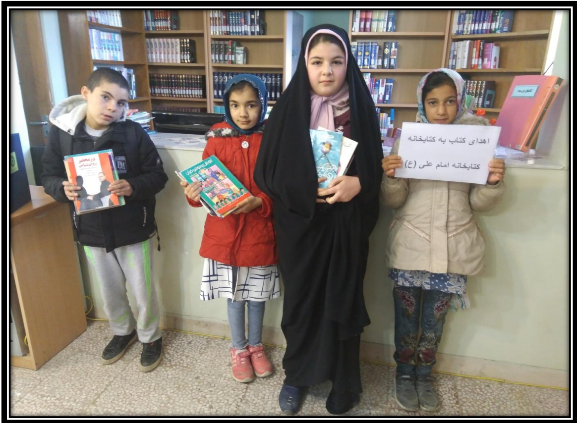
ثبت نام رایگان در کتابخانه