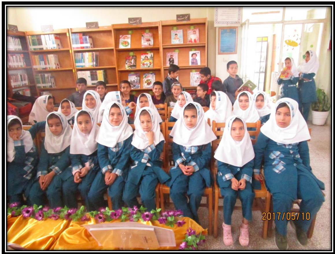
بازدید نوجوانان از کتابخانه به مناسبت جشنواره رضوی