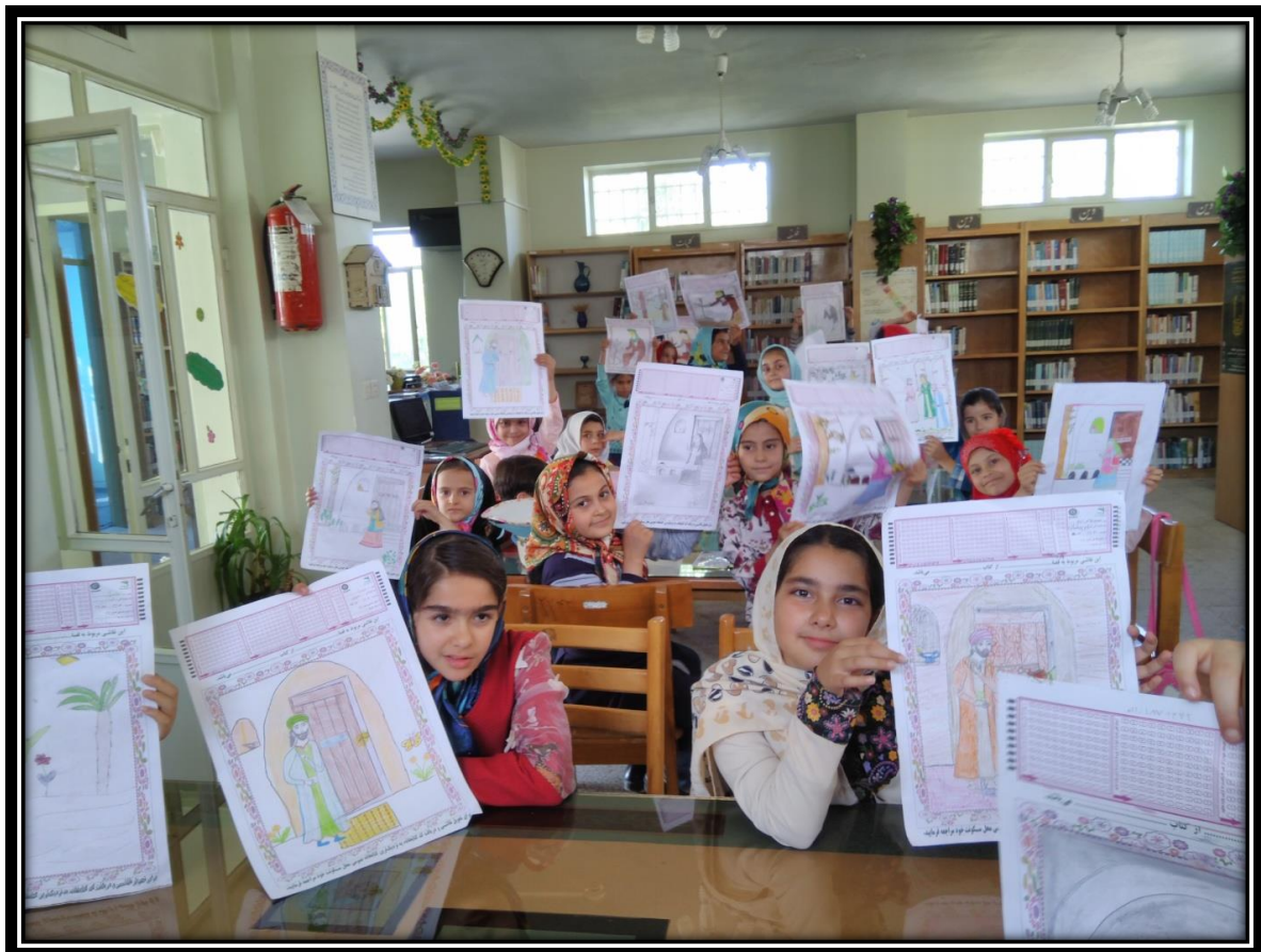
بازدید دانش آموزان