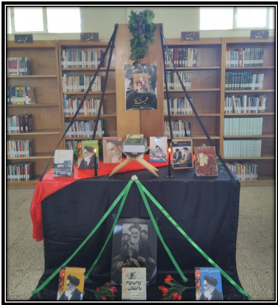
نمایشگاه کتاب به مناسبت یلدای ۹۷