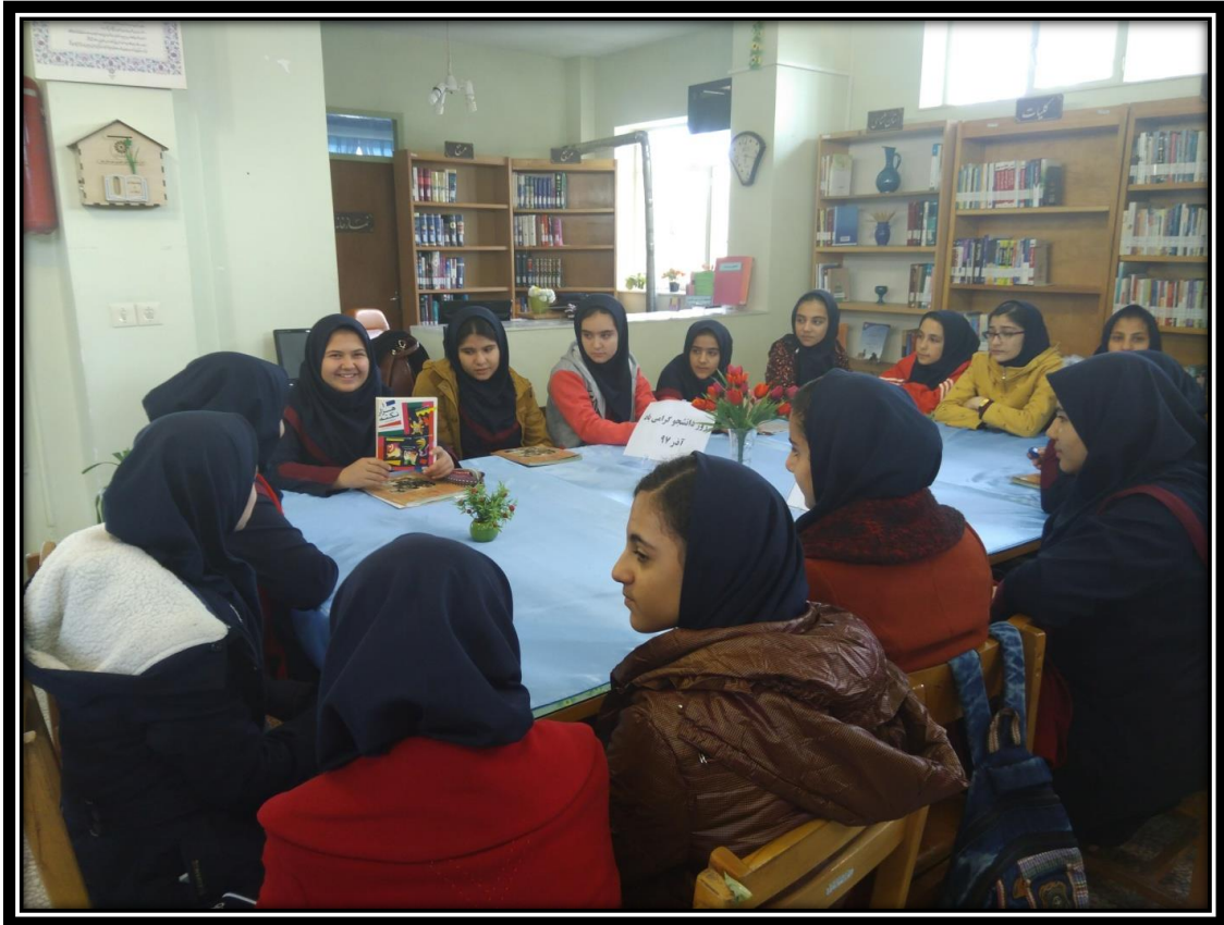
نشست کتابخوان به مناسبت یلدا ۹۷