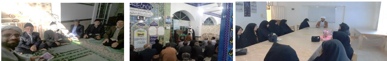
از برنامه های مشترک مسجد و کتابخانه