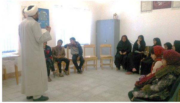
کارگاه احکام به کمک بازی با کلمات