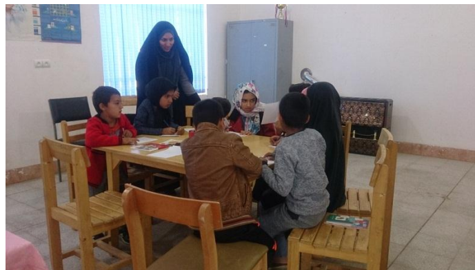
کارگاه داستان نویسی