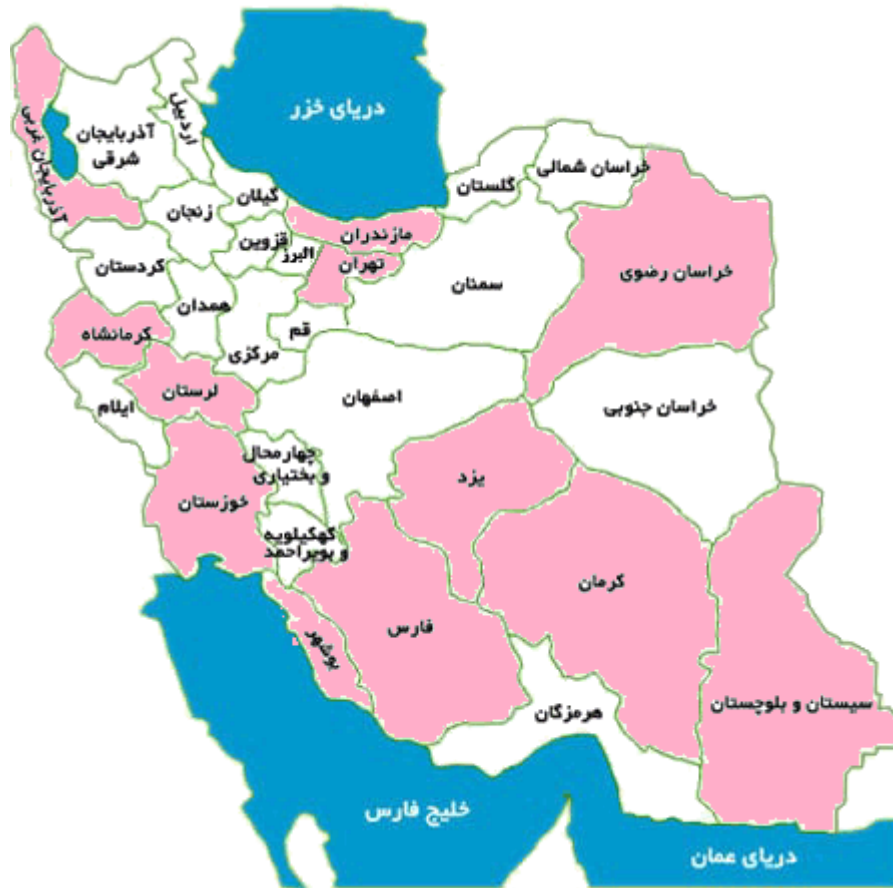
پراکندگی شهرهای راه یافته به مرحله نهایی پنجمین برنامه انتخاب و معرفی پایتخت کتاب ایران ۱۳۹۷