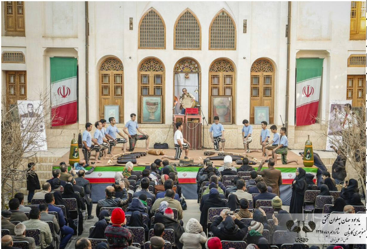
یادبود جهان پهلوان فتحی نهمین جشنواره کاشان شماره دوم دیماه ۱۳۹۵ مس از علی زوی شاهچراغی

زمان: ۱۳ تا ۱۸ بهمن ۱۳۹۵ مکان: بلوار امام رضا (ع) مصلای بزرگ کاشان ساعات بازدید: ۹ تا ۱۲ - ۱۶ تا ۲۰